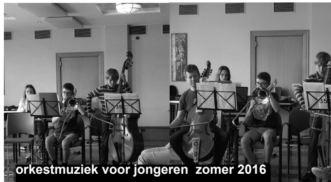
orkestmuziek voor jongeren zomer 2016

Twijfel je over je niveau mail dan naar: info@halewynstichting.be